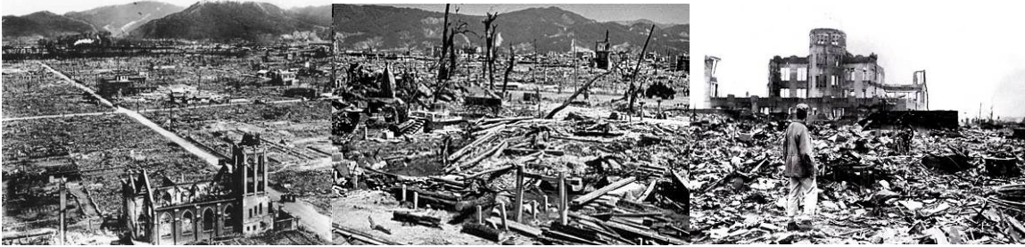
Slika 1. Želimo li ovakvu budućnost ili promene

Zbog grešaka, stanje permanentnog zagađenja životne sredine je naša sumorna realnost. Planeta Zemlja ne može izdržati rat većih razmera. Očekivane posledice i reakcije odraziće se kroz požare, zemljotrese, erupcije vulkana, ali i bez toga ekološka kriza je već dosegla vrlo neugodne razmere. Ekonomski interesi prelaze granice nacionalnih država i ne pitaju za prirodne katastrofe. Ekološka kriza prevladava i ekonomsku paradigmu i to zbog opasnosti koja će se svetu navesti nad glavom.