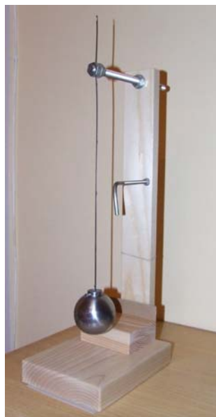
Slika 3. U pripremi je promocija novog prototipa edukativne igrčke ili učila za škole (višestruki dokaz da overunity postoji)

Kako već postoje istraživanja na bazi pogonskog klatna, potrebno je širiti ovu informaciju jer je gravitacija svima dostupna i nepotrošna. Dosadašnja dostignuća na ovom polju ne treba shvatiti kao konačna jer su istraživanja i usavršavanja u toku u čemu učestvuju hiljade istraživača širom sveta.