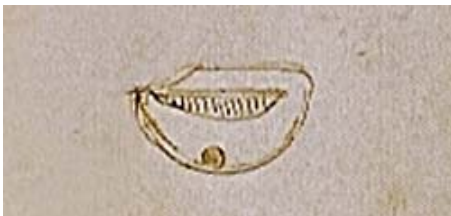
slika 2. detalj sa crteža gravitacione mašine da Vinčija

Analizom i poređenjem otkriva se višestruko poboljšanje – kroz smanjenje trenja i „upregnutom“ gravitacijom.