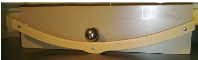
slika 3. replika detalja, naizmenično kotrljanje kuglice traje 22 sekunde